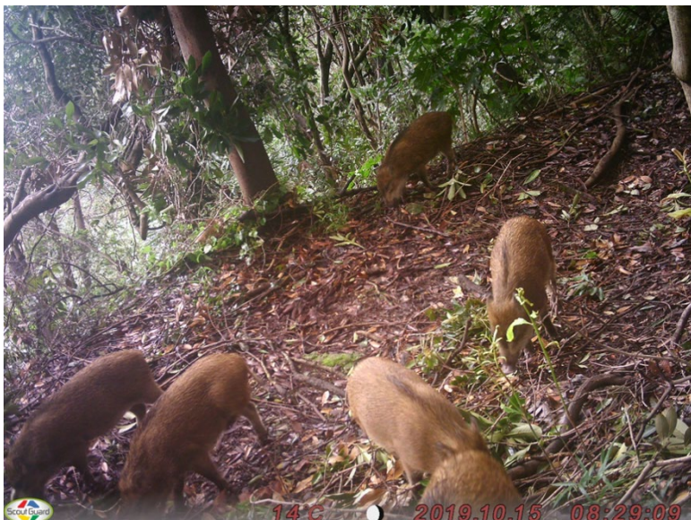
田浦大作町山林内（2019. 10. 15） イノシシ仔 6頭